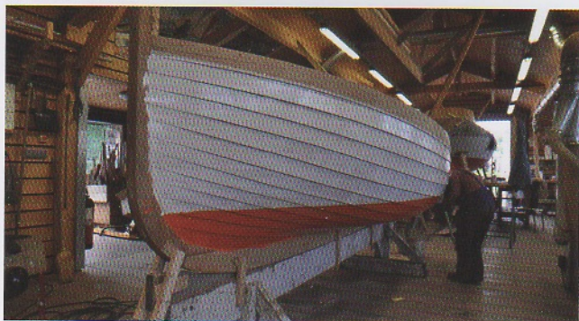
Camin du Havre.