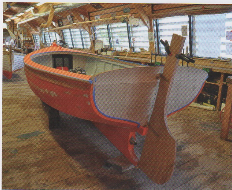
Canot breton à moteur GAMIN.