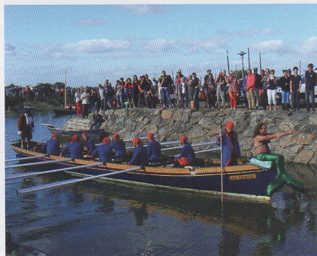
Fête du Bois salé en 2015.

Depuis, la Fête du Bois salé anime le port de Kercabellec tous les deux ans, en partenariat avec Skol Ar Mor.