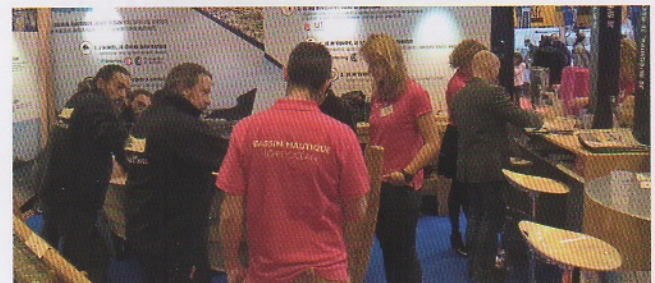
Participation au salon Nautique International à Paris en 2015 - sur l'Espace de la région des Pays de la Loire, sur le stand du territoire de Cap Atlantique et la Carène et sur celui de l'association des propriétaires de "requins."