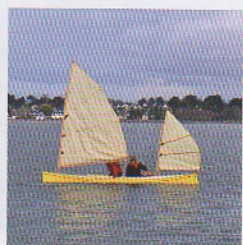
Canoë voyageur à voile "Zorra."