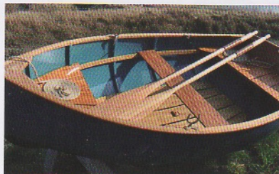
Annexe Morbic 8 "Robustus."