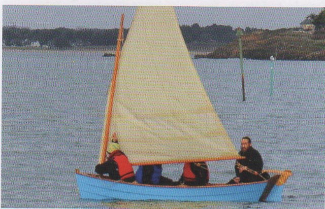
Plat à voile, type Zen Skiff "Keleenn."