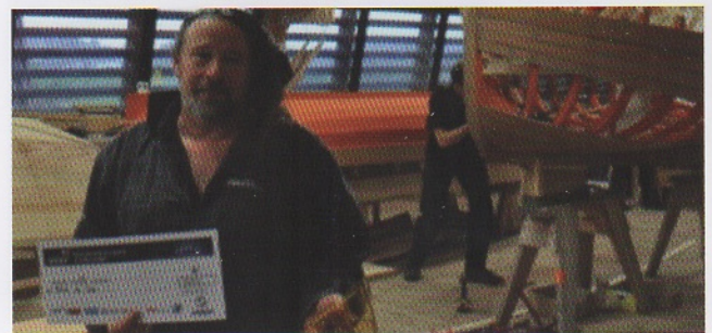
Récompensé dans la catégorie "Défi Innovation sociale", dans le cadre des Audacity Awards 2015.