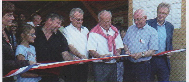
Inauguration de la salorge le 15 septembre 2012.