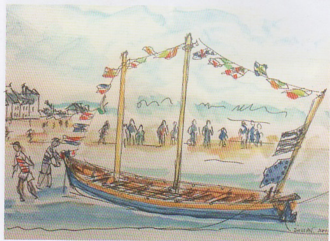
Œuvre de Patrick DUGGAN, mesquériais, illustrant l'arrivée de la Yole.